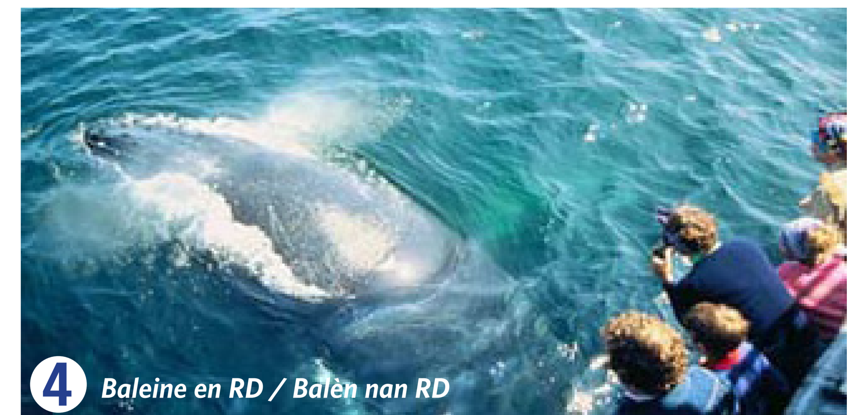
4 Baleine en RD / Balèn nan RD

Les mammifères marins, incluant les baleines, les dauphins, les lamantins, les phoques et même les ours polaires, sont des animaux fascinants. Comme tous les mammifères, ils ont le sang chaud, ont des poils et allaitent leurs petits. Leur trait commun est qu'ils se sont adaptés pour vivre dans l'océan, du moins la plupart du temps, bien que, en tant que mammifères, ils doivent respirer de l'air (photo 4). Dans le monde, plus du quart de tous les mammifères marins sont des espèces menacées.