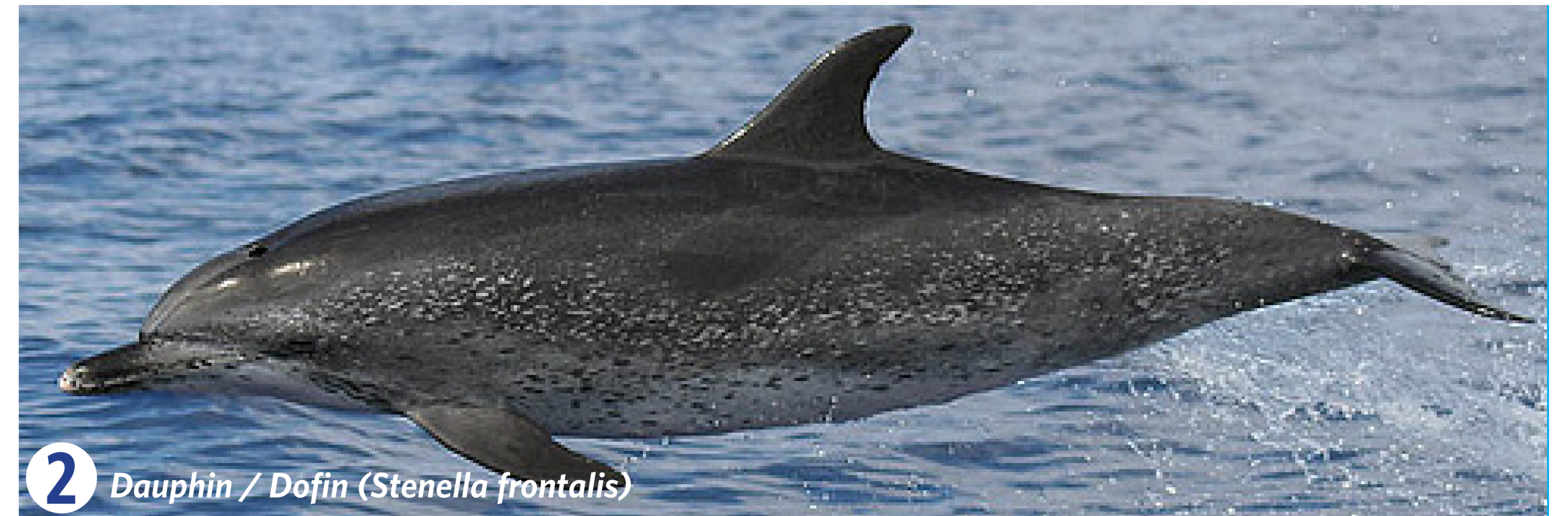
2 Dauphin / Dofin ( Stenella frontalis )