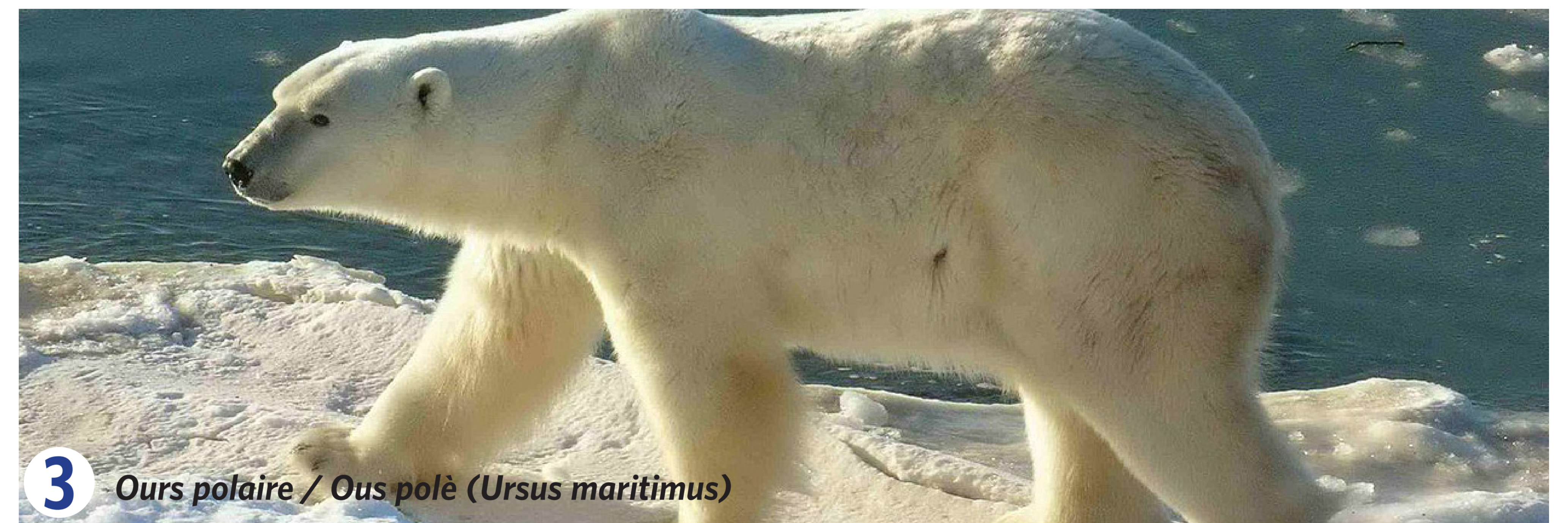
3 Ours polaire / Ous polè ( Ursus maritimus )