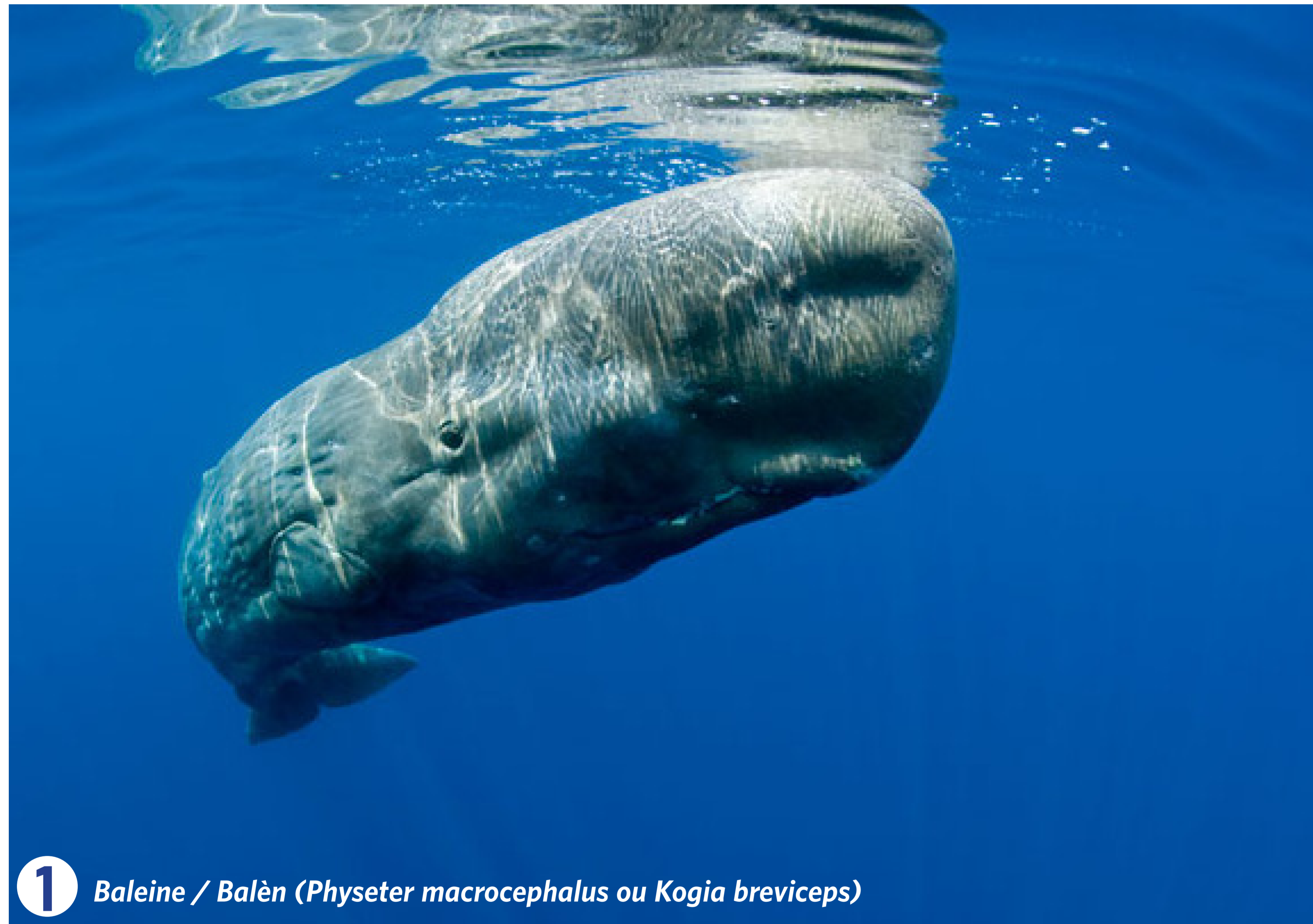
1 Baleine / Balèn ( Physeter macrocephalus ou Kogia breviceps )